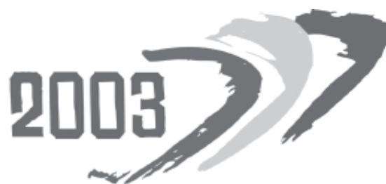
Det Europæiske Handicapår

Den officielle indvielse af Handicapår 2003 finder sted den 5. februar i København. Arrangementet er for indbudte repræsentanter fra handicaporganisationerne, kommuner, amter, Folketinget samt øvrige repræsentanter fra det