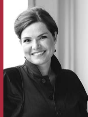
Beskæftigelsesminister Inger Støjberg gæstede Det Centrale Handicapråd